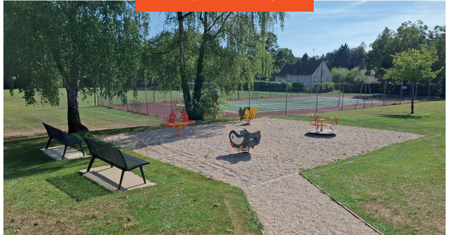
Aire de jeux, près de la bibliothèque, après travaux