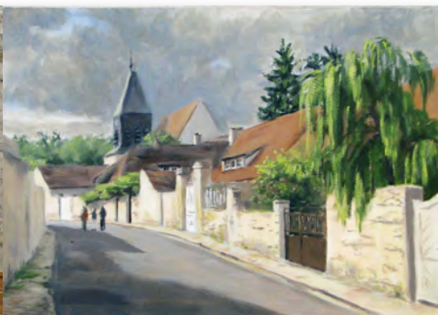
CLÉO TEBBY QUI REMPORTE LE 1 ER PRIX