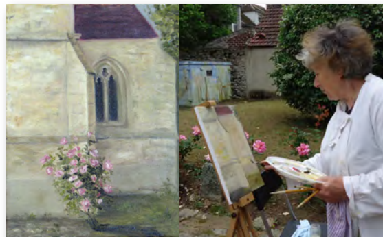
DANIELLE LE JOUAN